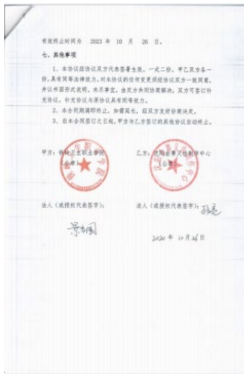
图 2 沈阳金赛义齿制作中心校企合作协议书

2.课程 设置 ：沈阳金赛义齿制作中心结合行业实际需求，开发了一系列具有实用性的课程，如全瓷修复技术、金属烤瓷技术、数字化设计、全口义齿制作技术、可摘局部义齿制作技术等。