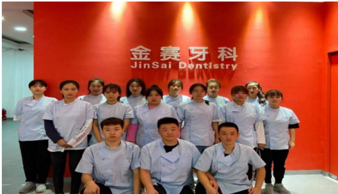
图 5 在沈阳金赛义齿制作中心工作的我院毕业生