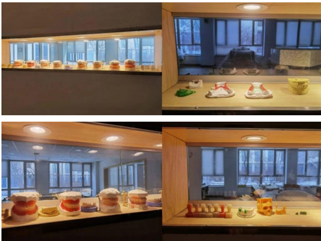
图 14 沈阳金赛义齿制作中心为我院建设实训基地缩影

2011年3月，我专业与沈阳金赛义齿制作中心等共同成立了口腔医学技术专业建设指导委员会。在专业建设指导委员会的指导下，校企合作共同编写教学大纲，完成人才培养方案，共同建设创新型实训基地，聘请企业技师与我专任教师共同完成实训课教学。实训中心在2015年顺利通过省级创新型实训基地验收。