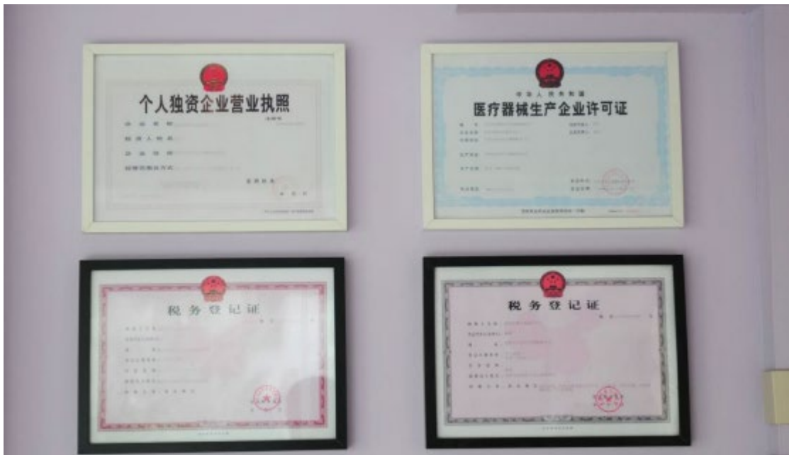
图 1 沈阳金赛义齿制作中心企业资质

沈阳金赛义齿制作中心成立于 2001 年，目前是辽沈地区规模较大、研发品类较全、业务覆盖范围较广、服务口碑较佳的义齿制作机构。公司成立 20 余年，始终致力于“再现完美笑容”的品牌使命，用最真诚的服务、最优质的产品链接每一位合作伙伴。践行“客户至上”的服务理念，在业内产生了影响深远的文化口碑。公司布局战略以沈阳总部为核心，辐射周边吉林、内蒙、河北、山东等省会，力争覆盖全国一二线城市。同时打通口腔义齿行业壁垒，实现全产业链条、全业务体系不断向全国义齿市场纵深发展的宏伟蓝图。