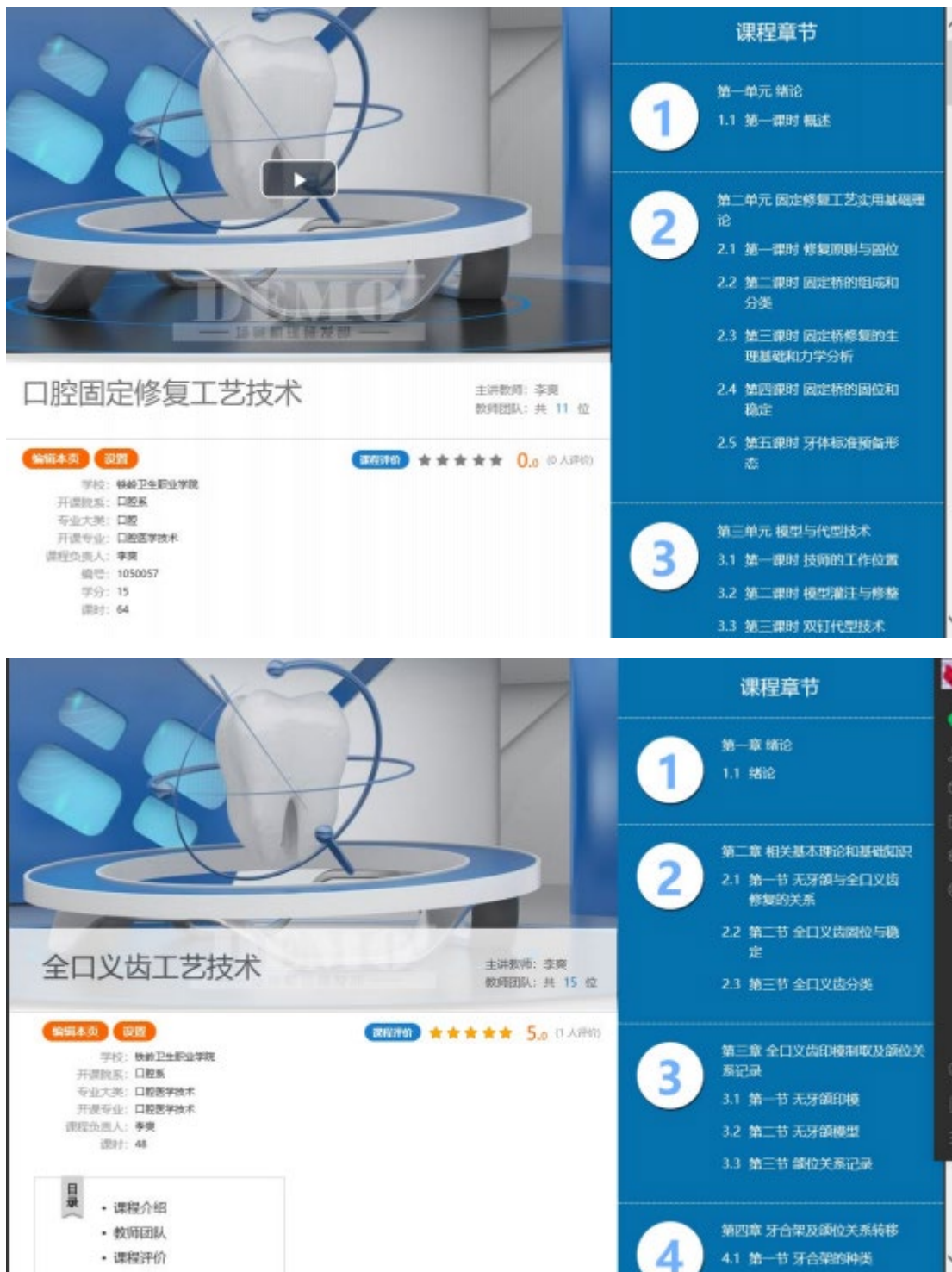
图 16 与沈阳金赛义齿制作中心合作的网络课