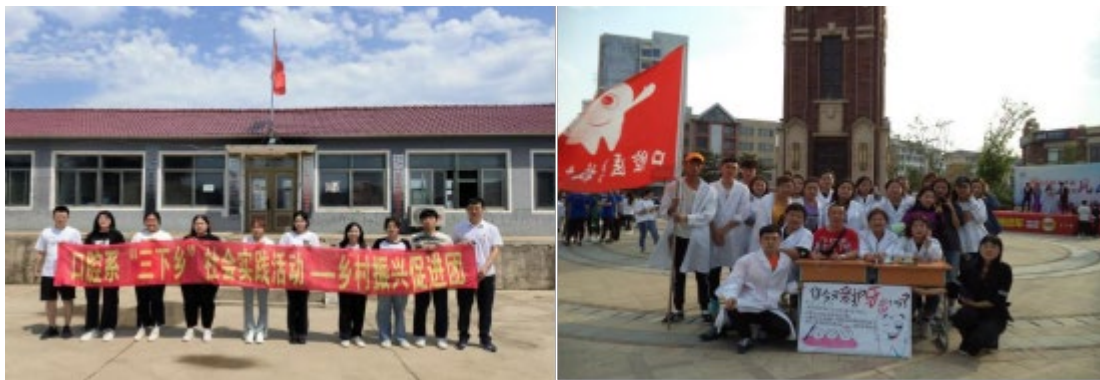
图 13 口腔系学生社会实践