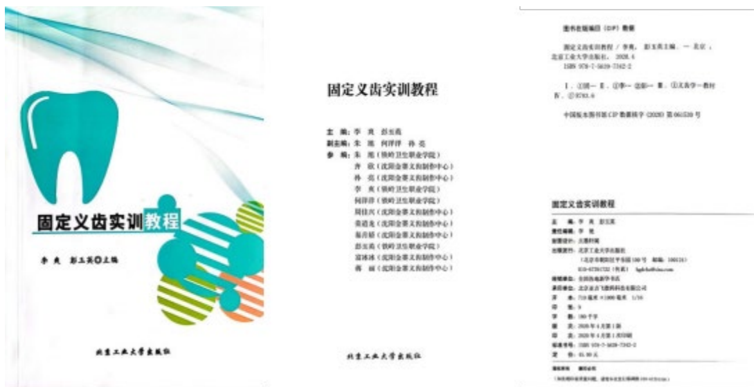
图9 沈阳金赛义齿制作中心与口腔系共同开发校企合作教材

2021年校企合作完成网络课程建设，专业核心课《固定义齿》《全口义齿》《可摘局部义齿》。企业配合学校完成照片及视频的拍摄，提供设备、场地、技师等，完成校企合作教材《固定义齿实训教程》，由北京工业大学出版社正式出版，面向全国发行。