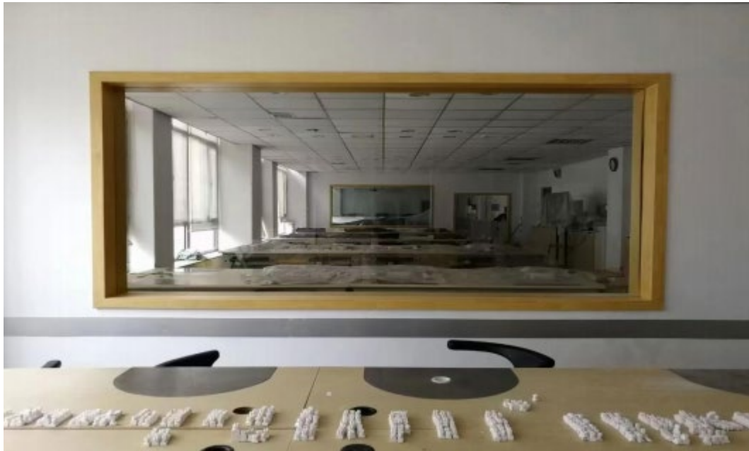
图 4 沈阳金赛义齿制作中心为我院建设的实训基地

4.职业素养培养：沈阳金赛义齿制作中心注重学生职业素养的培养，通过企业文化传播、职业道德教育等方式，帮助学生树立正确的职业观念和职业道德意识。