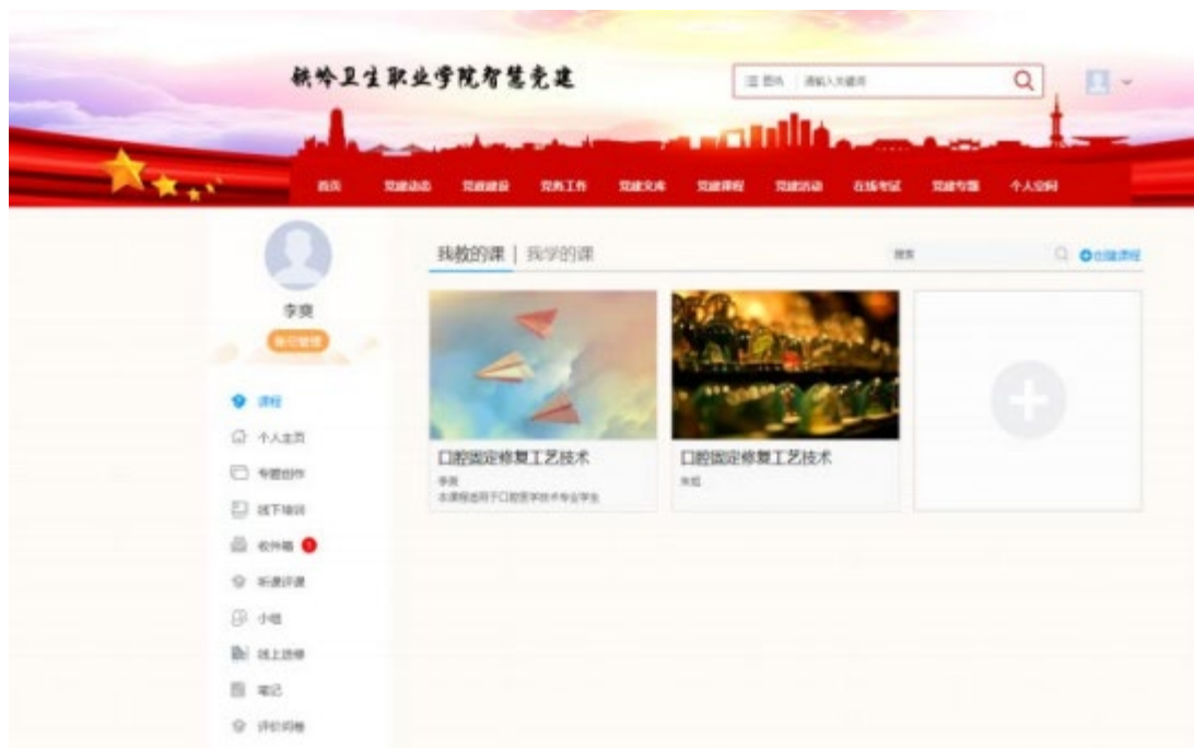
图 11 沈阳金赛义齿制作中心与我院合作完成的网络课网页截图