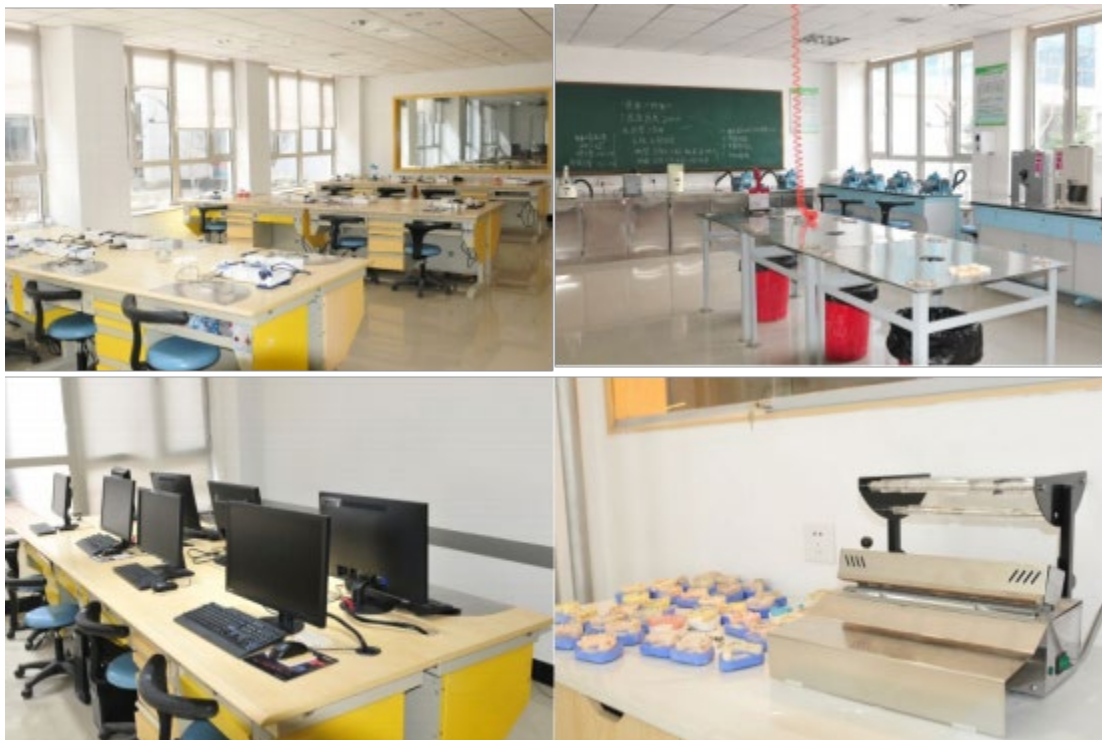
图 7 沈阳金赛义齿制作中心为口腔系捐

为解决职业技术学院实训室缺乏教具问题，2016年沈阳金赛义齿制作中心出资为学院建设口腔系实训基地，并捐赠技工台、烤瓷炉、气泵、电脑等设备。并派出多名技师在校配合校方教师对学生技能进行培训。