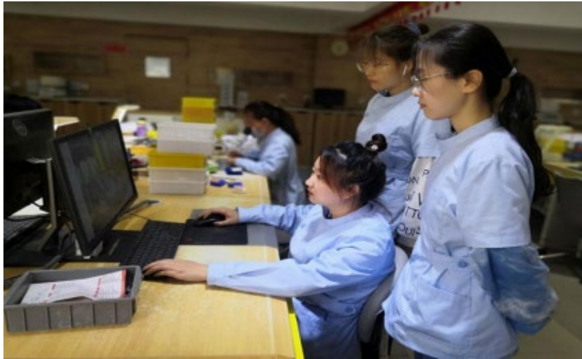
图 6 沈阳金赛义齿制作中心企业技师指导学生操作