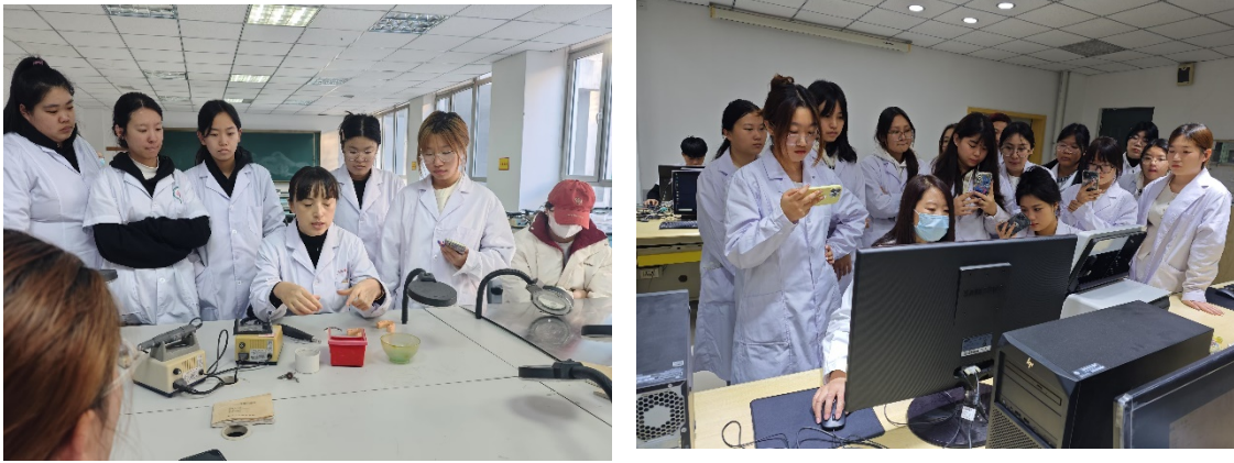
图8 沈阳金赛义齿制作中心企业技师来院为学生授课