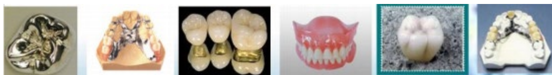
图 3 沈阳金赛义齿制作中心产品展示

2.课程 设置 ：沈阳金赛义齿制作中心结合行业实际需求，开发了一系列具有实用性的课程，如全瓷修复技术、金属烤瓷技术、数字化设计、全口义齿制作技术、可摘局部义齿制作技术等。