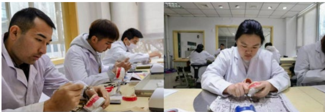
图 12 口腔系学生日常练习

课程建设是专业建设的一部分，课程建设必须围绕专业建设和专业人才培养的要求来进行。学院在进行课程设置时始终以学习者为中心，为不同层次不同类型的学生提供个性化、多样化、高质量的教学服务。实施“五育并举”，培养“德智体美劳”全面发展的社会主义建设者和接班人；推行“课程思政”改革，构建立体化、全方位立德树人新生态；打造4门专业核心课程网络课程建设，形成“互联网+职业教育”新形态；实施“课堂革命”，推行以超星智慧教学平台为载体，以混合式教学为手段，以远程协作、实时互动、翻转课堂、移动学习为特征的信息化教学模式改革；推行“线上学习+线下实操+线上线下讨论”的混合教学方式，建立适应混合式教学方法的学生考核、教师教学质量评价方式。