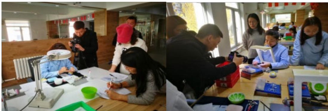
图 10在沈阳金赛义齿制作中心录制网络课程