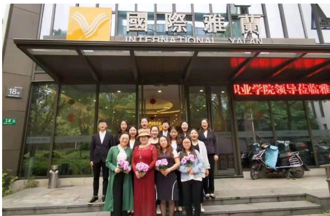
图 3. 铁岭卫生职业学院领导及教师莅临我公司