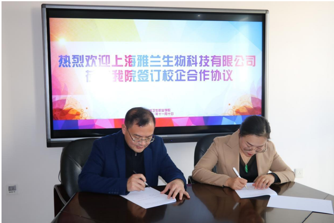
图 4. 公司领导与铁岭卫生职业学院领导签订校企合作协议书