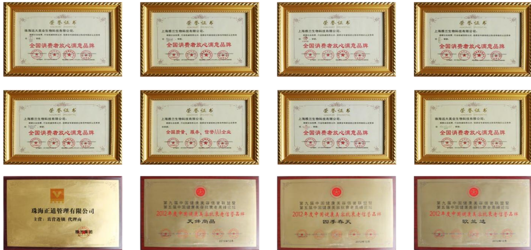
图 1. 企业荣誉