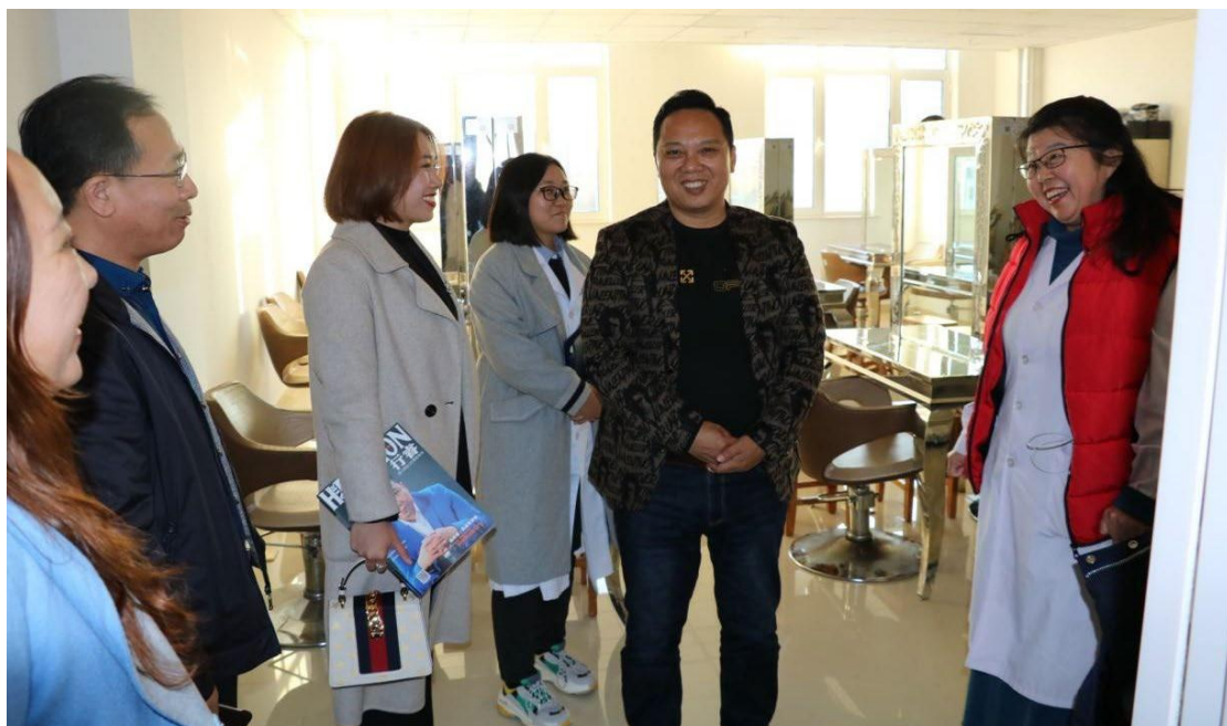
图 2. 公司领导在铁岭卫生职业学院参观考察

议。校企双方就订单式人才培养、校内外实训基地建设、美容院发展规划、科技研发推广等诸多领域达成合作共识，拓展了产业链条，形成了多点、多元支撑的发展格局。