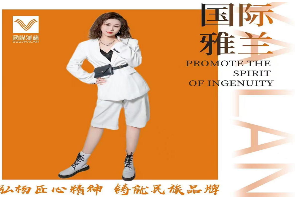
图 8. 优秀毕业生