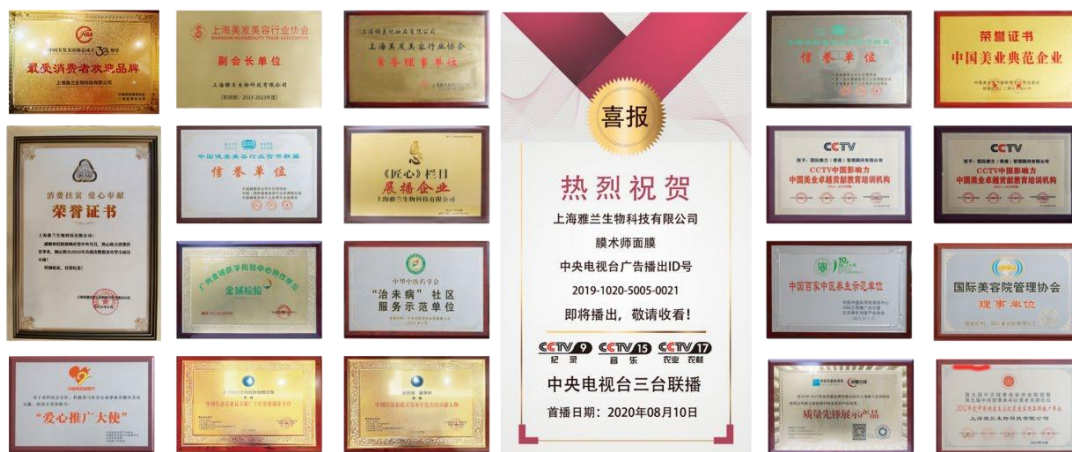
图 9. 企业创新荣誉