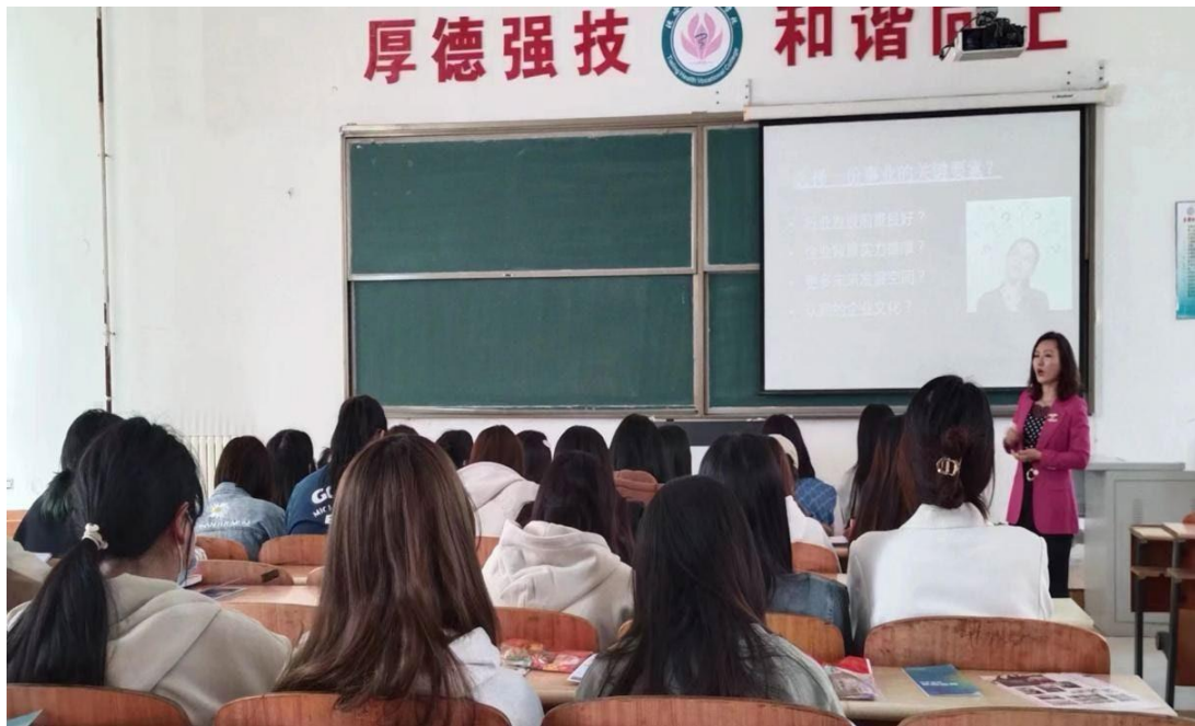
图 5. 企业导师下校园授课