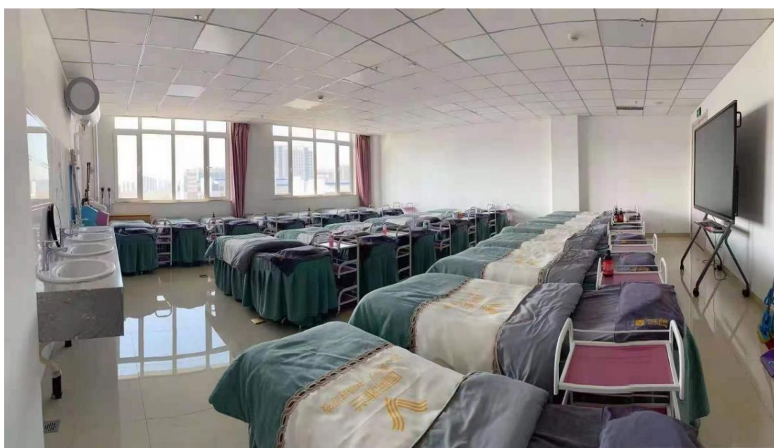
图 7. 援建学院校内实训室

90 余万元，仿真工作环境的构建为学生“教-学-做”一体化教学提供了硬件支撑。校企合作以来，雅兰公司积极参与实训中心建设，通过资金扶持，产品赞助等方式协助美容专业打造高水平结构化产教融合实训基地，目前，专业正在积极推进智慧化实训室建设，未来校企双方将携手共建模拟美容院，营建仿真实训环境，通过校内“职场课堂”创设，让学生更好感知职场氛围，提升职业素养，提高实训效果。